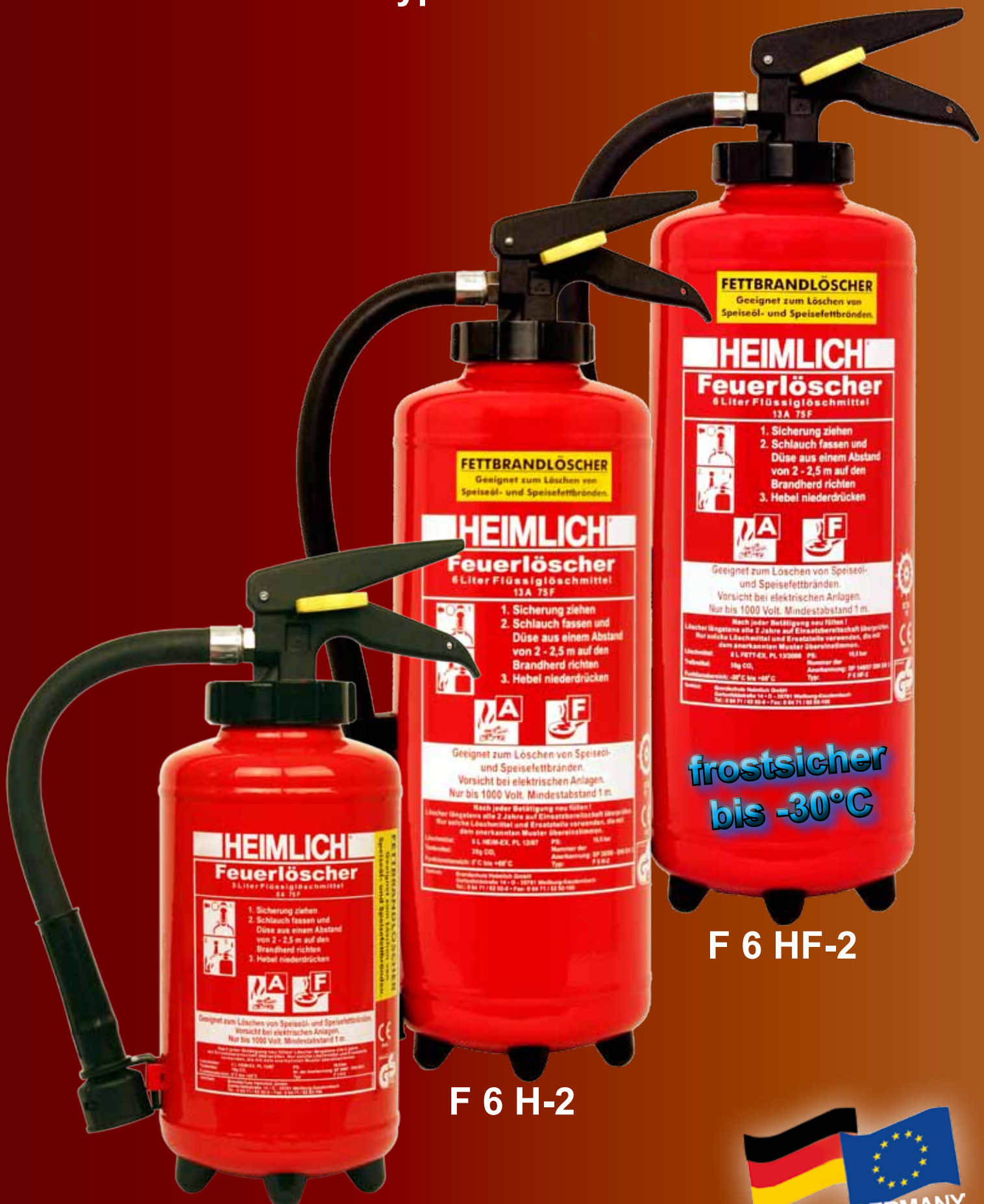
F 3 H-2

Fettbrandlöscher Typ F 3 H-2 / F 6 H-2 & F 6 HF-2