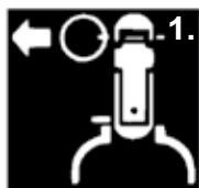
1. Sicherung ziehen